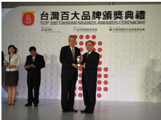
由行政院 吳敦義院長頒發台灣百大品牌獎